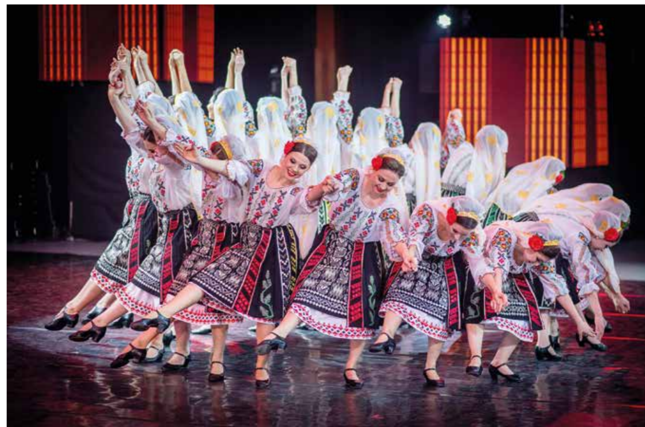
„JOC” jest jednym z głównych popularyzatorów mołdawskiej kultury zarówno w Mołdawii, jak i za granicą. Przedstawienia teatralne zespołu ukazują tradycje i rytuały ucieleśnione w pełnych gracji i ekspresji ruchach. Kalejdoskop najpiękniejszych mołdawskich tańców i porywającej muzyki ludowej nie pozostawia nikogo obojętnym.