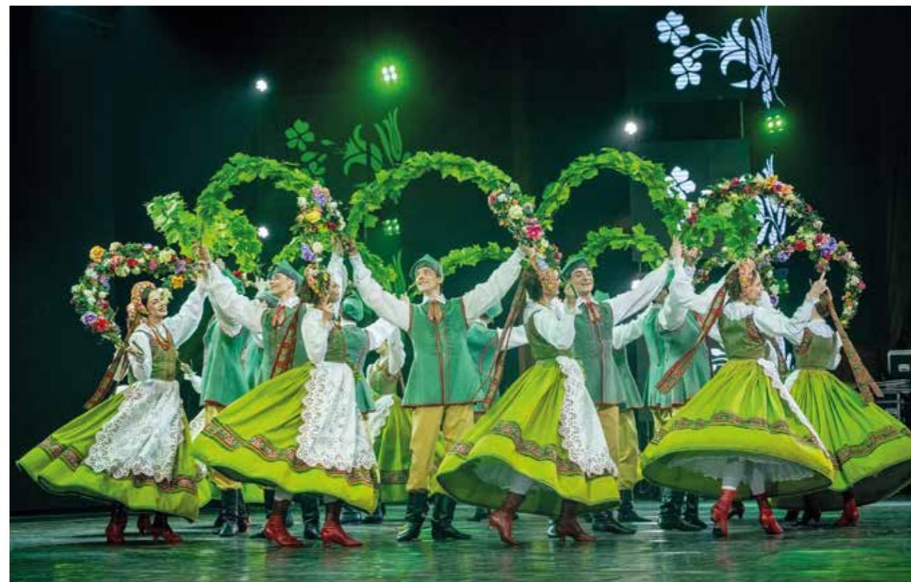
Muzyka, taniec, śpiew i feeria barw strojów z różnych regionów Polski – taką porcję polskości zaproponował mołdawskiej publiczności Państwowy Zespół Ludowy Pieśni i Tańca „MAZOWSZE”. Niezwykle widowiskowe były tańce z okolic Zielonej Góry z girlandami winorośli i kwiatów.