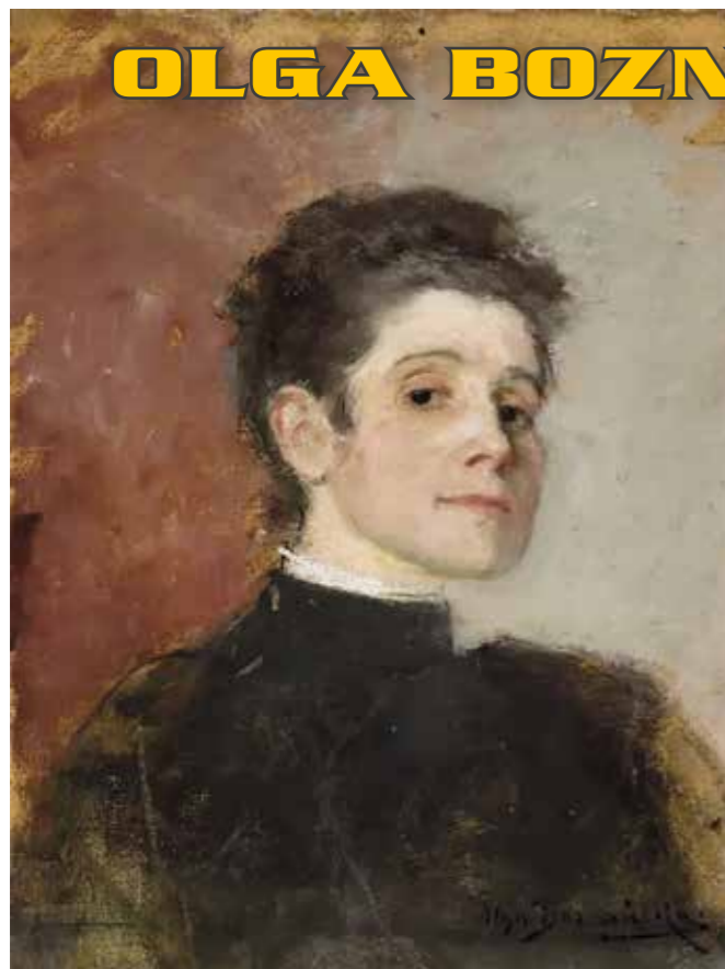
■ Autoportret Olgi Boznańskiej ze zbiorów Muzeum Narodowego w Warszawie

W 2025 roku przypada 160. rocznica urodzin oraz 85. rocznica śmierci Olgi Boznańskiej – jednej z najważniejszych postaci polskiego świata artystycznego przełomu XIX i XX wieku, najbardziej znanej polskiej artystki tego okresu.