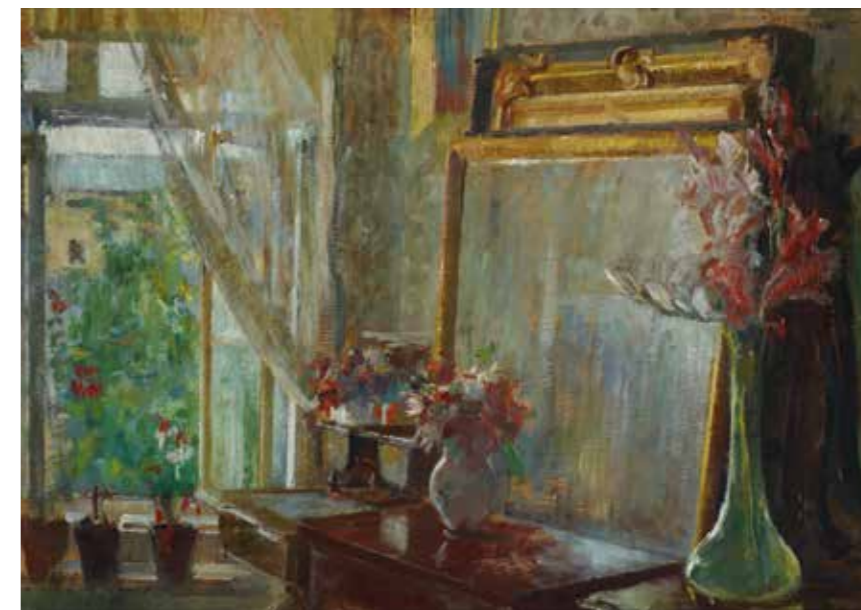
■ Olga Boznańska, Wnętrze