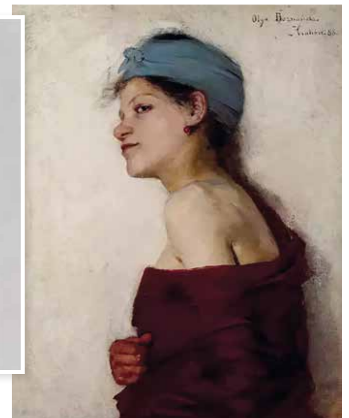
■ Olga Boznańska, Portret kobiety (Cyganka), 1888, Muzeum Narodowe w Krakowie