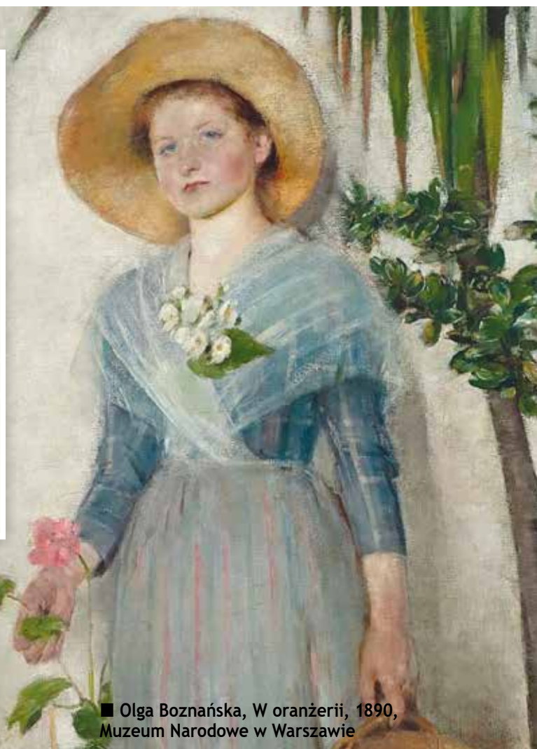
■ Olga Boznańska, W oranżerii, 1890, Muzeum Narodowe w Warszawie

„Na urodzinach u Olgi Boznańskiej” - projekt Stowarzyszenia „Polonia” w Rybnicy