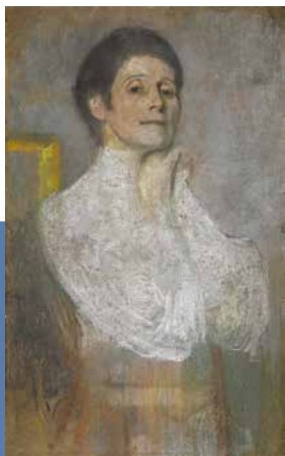
■ Olga Boznańska, Autoportret

Olga Boznańska była zawsze bardziej doceniana za granicą niż w rodzinnym Krakowie. Wyspiański,