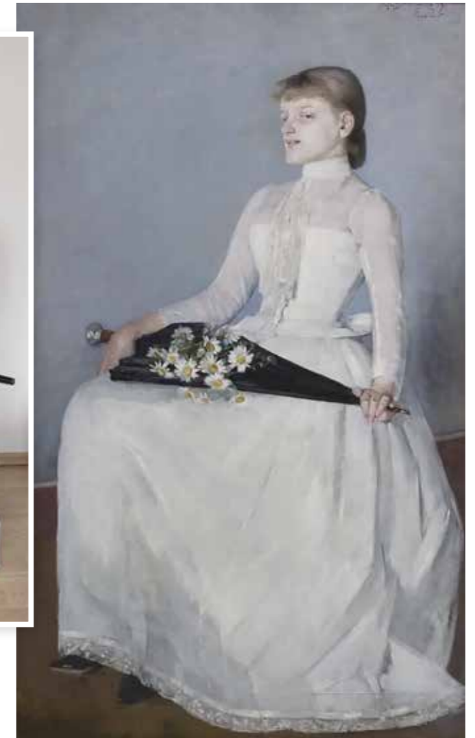
■ Olga Boznańska, Ze spaceru, 1889, Muzeum Narodowe w Krakowie.