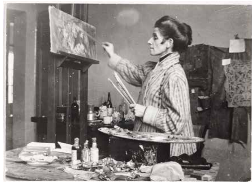
■ Olga Boznańska w pracowni w domu w Krakowie, ok. 1920 roku

Boy-Żeleński dostrzegali wartość jej obrazów, ale np. Jacek Malczewski nazywał je „zakopconymi”. Uznanie w ojczyźnie przyszło z czasem.