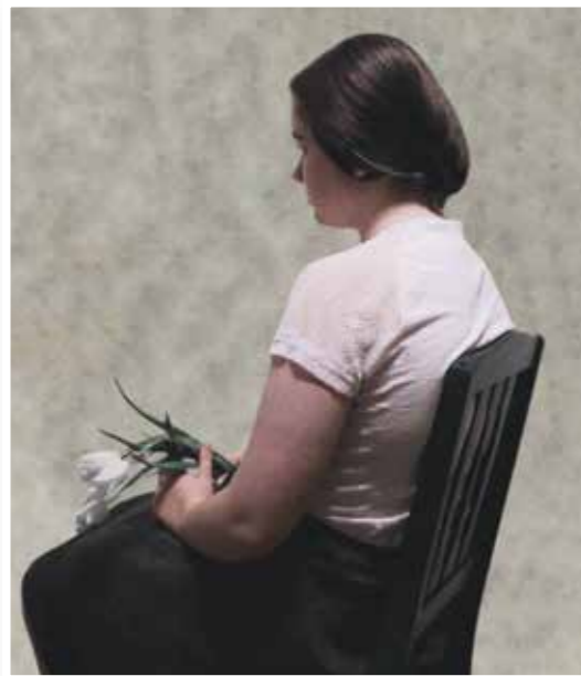
■ Olga Boznańska, Kobieta z tulipanami, 1898, Muzeum Narodowe w Poznaniu