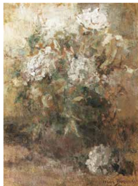
■ Olga Boznańska, Kwiaty wazonie

„Obrazy Boznańskiej należą do najważniejszych dzieł polskiego malarstwa modernistycznego i kanonu historii sztuki, a jej kariera stanowi przykład jednego z najwybitniejszych polskich sukcesów artystycznych na arenie międzynarodowej” – uzasadnili posłowie.