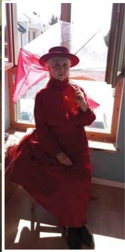
■ Olga Boznańska, Kobieta z japońską parasolką, 1892, Muzeum Narodowe we Wrocławiu