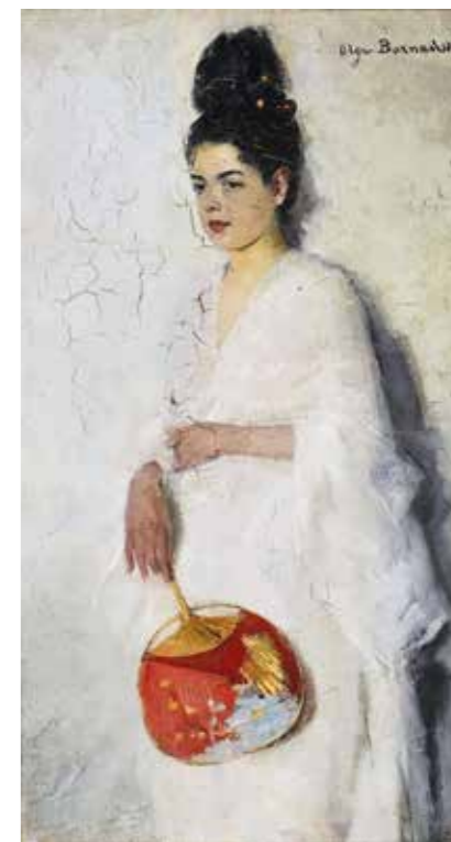
■ Olga Boznańska, Japonka, 1889

Boznańska nigdy nie rozstawiała sztalug w plenerze, nawet widoki miejskie czy pejzaże powstawały